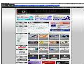
オビタスター株式会社