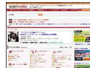
ターゲットメディア 株式会社