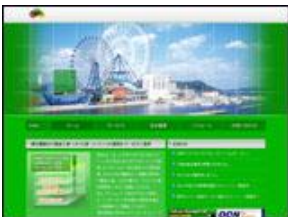
株式会社 エヌ・ディ・エステレコム