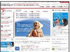
株式会社 スマイルヴィジョン