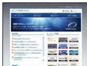
オーシャンネットワーク 合同会社