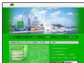
株式会社 エヌ・ディ・エステレコム