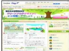
株式会社ライブドア