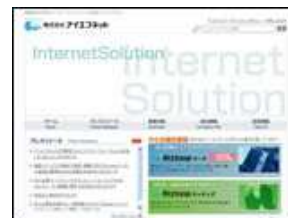
株式会社 アイエフネット