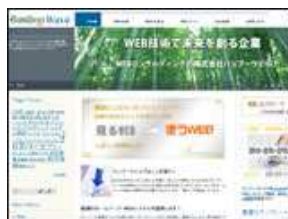
株式会社 バンブーウェイブ