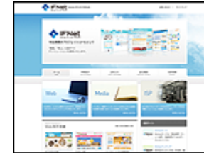
株式会社 アイエフネット