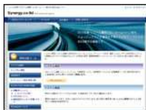
株式会社シナジー