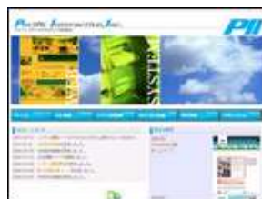
パシフィックインタラクティブ 株式会社