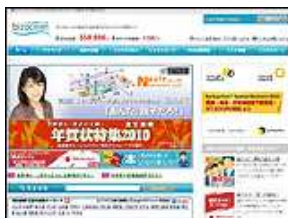
株式会社 ミロク情報サービス