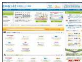
株式会社 イー・エージェンシー