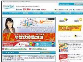
株式会社 ミロク情報サービス