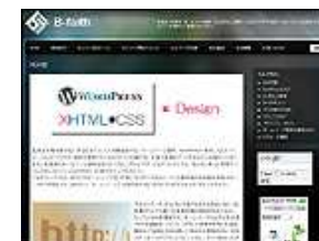
ビルドフェイス 有限会社