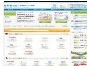
株式会社 イー・エージェンシー