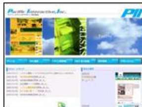
パシフィックインタラクティブ 株式会社