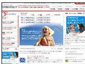
株式会社 スマイルビジョン