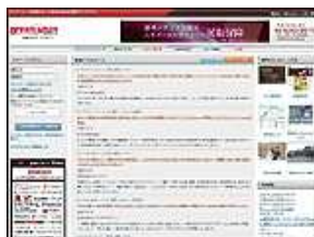
グローバルインサイト 株式会社