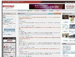
グローバルインサイト 株式会社