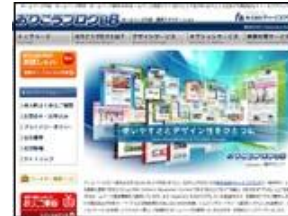
ディーエスブランド 株式会社