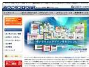
ディーエスブランド 株式会社