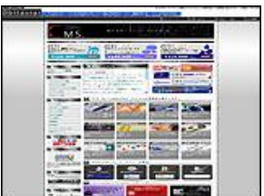
オビスター株式会社