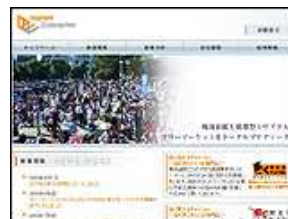
株式会社 マーケットエンタープライズ