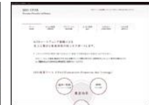
株式会社 デジタルスタジオ