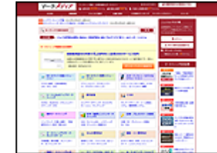
ターゲットメディア 株式会社