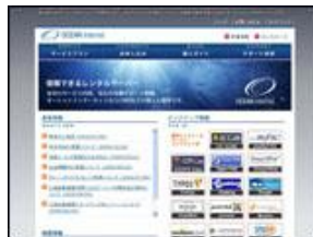
オーシャンネットワーク 合同会社