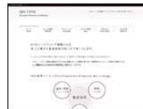
株式会社 デジタルスタジオ