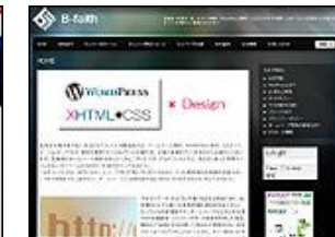
ビルドフェイス 有限会社