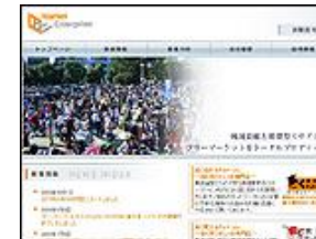
株式会社 マーケットエンタープライズ