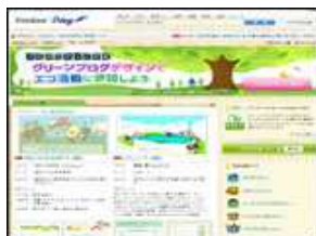
株式会社ライブドア