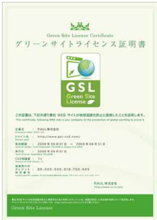
グリーンサイトライセンス証明書

グリーンサイトライセンスをご購入いただいたお客様には、証明書(紙版)の販売も行なっております。