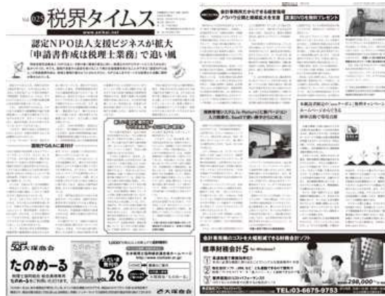
税会タイムス vol.025 (2011年12月20日発行)

GSLサポートセンター ☎ 0120-971-610 ※お気軽にご連絡ください 平日:10時~20時まで