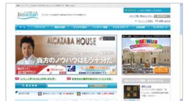
株式会社ミロク情報サービス様 ビジネス情報サイト「海」bizocean