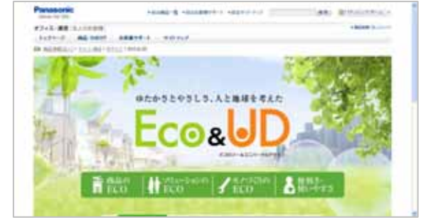
パナソニック システム ネットワークス株式会社 ECO & UD