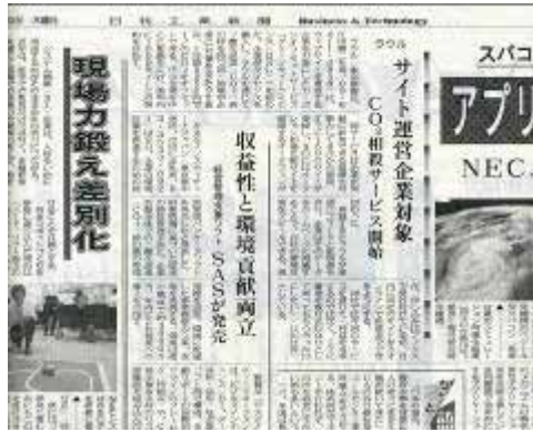
日刊工業新聞 9面 (2008年7月10日発行)