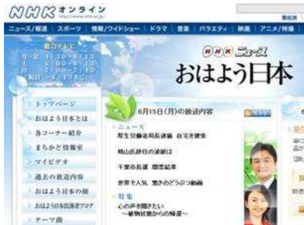
NHKニュース おはよう日本