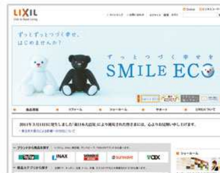
株式会社LIXIL様 コーポレートサイト