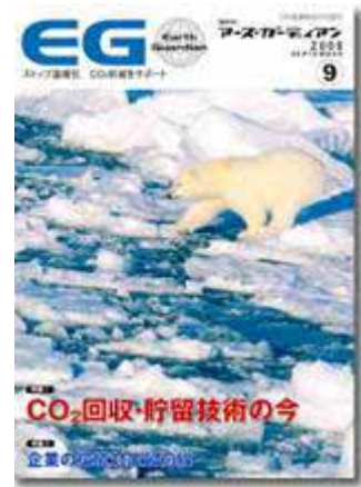
アース・ガーディアン(9月号) ストップ温暖化 co2削減サポート