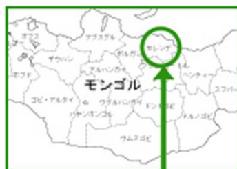
モンゴル国セレンゲ県

セレンゲ県は、過去の大火災で森林の約70%（32,000ha）を失い、植生の草地化や森林の回復が危惧されている場所です。モンゴルの森林面積は国土の10%以下。世界平均30%と比べても緑が少なく、砂漠化が深刻化している国の1つです。