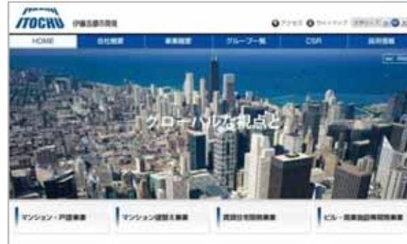
伊藤忠都市開発株式会社