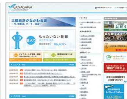
神奈川県庁様 KANAGAWA eco information