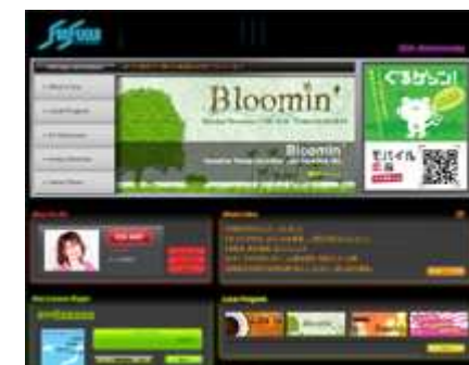
FM福井 【Eco(イーコ~ちょっといいことはじめる)】