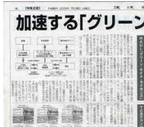
環境新聞 グリーンIT特集 (2008年7月1日発行)