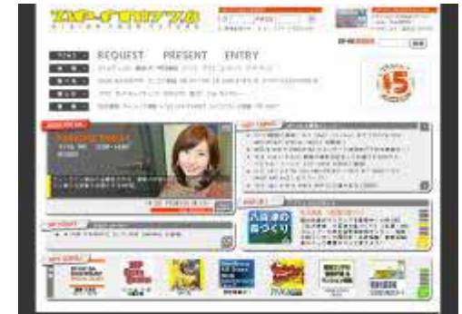
FM77.8 ZIPFM 環境特集番組