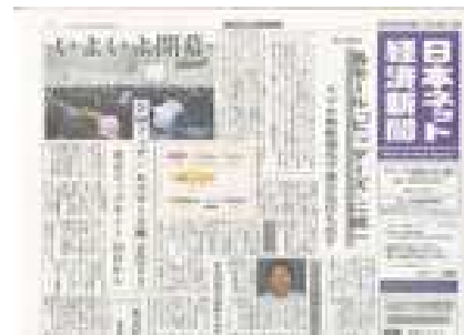
日本ネット経済新聞10月20・27日合併号 (2011年10月22日発行)