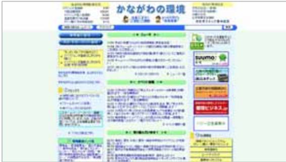
神奈川県庁様 かながわの環境