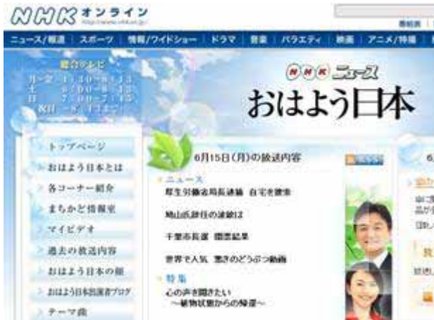
NHKニュース おはよう日本