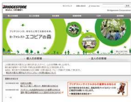
株式会社ブリヂストン様 コーポレートサイト