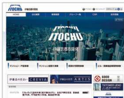
伊藤忠都市開発様 サービスサイト