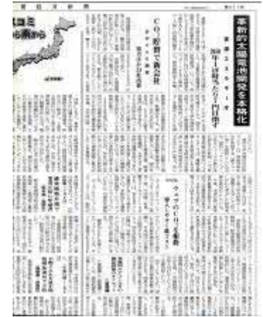
循環経済新聞 9面 (2008年7月1日発行)