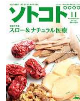
ソトコト 11月号No.149 (2011年10月5日発行)