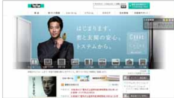
トステム株式会社 コーポレートサイト