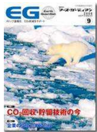
アース・ガーディアン (9月号) ストップ温暖化 co2削減サポート