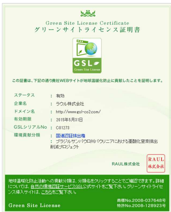
グリーンサイトライセンス証明書

グリーンサイトライセンスでは、 アクリルスタンド付き証明書 の販売も行なっております。