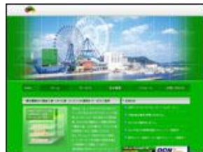
株式会社 エヌ・ディ・エステレコム