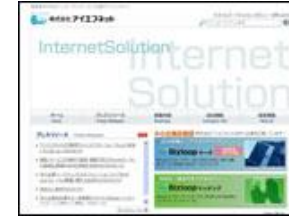
株式会社 アイエフネット