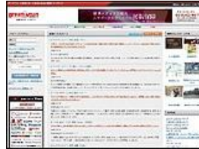
グローバルインサイト 株式会社