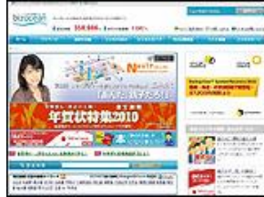
株式会社 ミロク情報サービス