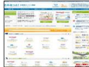
株式会社 イー・エージェンシー