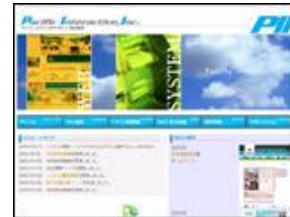
パシフィックインタラクティブ 株式会社