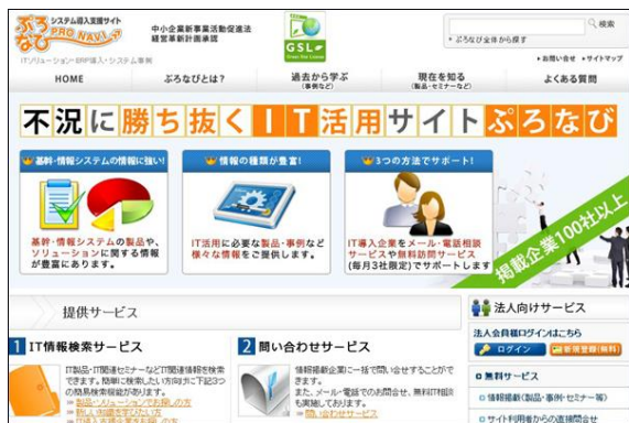
不況に勝ち抜くIT活用サイト 「ぶろなび」

気軽にはじめる環境活動「グリーンサイトライセンス（GSL）」では、パートナー制度にお申し込みいただいたWEB制作会社様やIT企業様を、「ぶろなび」／「CMSナビ」2つのサイトにて無料でPR記事を掲載し、ご紹介するキャンペーンを行っています。 GSLで貴社の環境意識をPRしながら新規クライアントを獲得のチャンス！