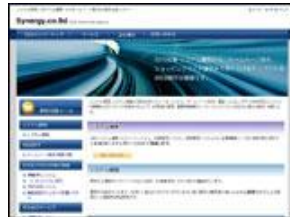
株式会社シナジー