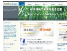
株式会社 バンブーウェイブ