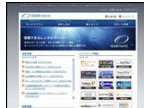
オーシャンネットワーク 合同会社