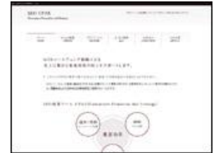
株式会社 デジタルスタジオ