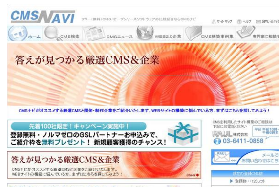
WEBサイトの制作・運用にお困りの WEB担当者様に最適なソリューションを提供する 「CMSナビ」