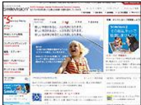
株式会社 スマイルビジョン