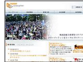
株式会社 マーケットエンタープライズ