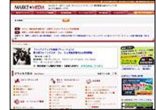
ターゲットメディア 株式会社