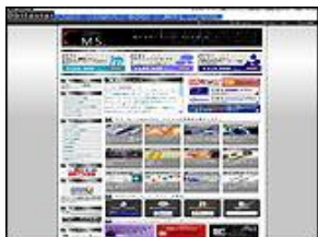
オビタスター株式会社