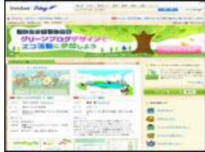
株式会社ライブドア