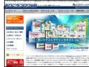
ディーエスブランド 株式会社