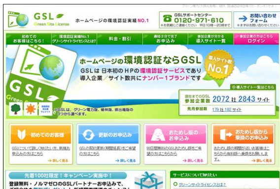
気軽にはじめる環境活動 「グリーンサイトライセンス（GSL）」