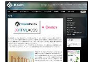
ビルドフェイス 有限会社